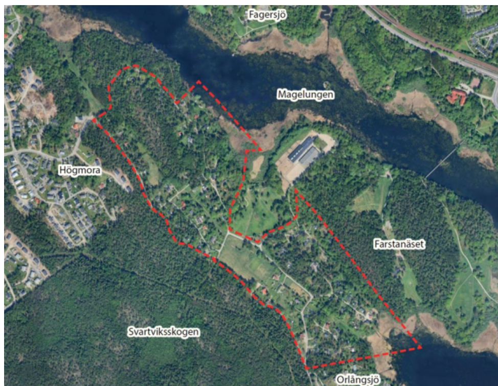
Figur 3. Flygfoto med planområdet markerat med streckad röd linje.

Detaljplanen möjliggör en omvandling av ett befintligt småhus- och fritidshusområde till permanentbostäder samt möjliggör för ny bebyggelse i form av nya bostäder och en grundskola. Detaljplanen möjliggör för 34 nya bostäder på kommunens mark i form av sammanbyggda småhus och enstaka friliggande småhus. Utöver detta möjliggörs avstyckning av befintliga fastigheter som kan tillskapa 34 nya fastigheter samt att befintliga fastigheter får utökad byggrätt. Alla befintliga småhusfastigheter blir till permanenta boenden med kommunalt vatten och avlopp. Genom att möjliggöra för radhusbebyggelse blir bostadsbeståndet i Svartvik mer blandat och når fler målgrupper. Inom planområdet tillskapas en park i anslutning till skoltomten vilket skapar en mötesplats där allmänheten kan träffas.